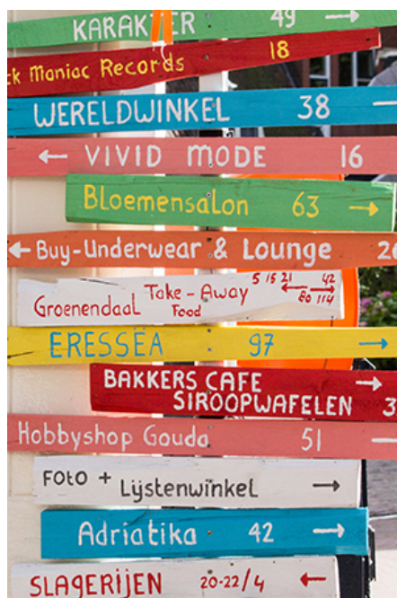
Foto: Verruiming van de mogelijkheden voor binnenstadondernemers om zich aantrekkelijker te presenteren.

In de binnenstad was veel dynamiek te zien waarbij sommige winkels helaas de deuren moesten sluiten, waarvan de V&D wel het meest in het oog sprong. Andere winkels in de binnenstad verhuisden naar een ander pand, verschillende pop-up winkels zijn gestart en ook zijn er nieuwe winkels, dienstverleners en horeca bij gekomen. Het aanbod aan detailhandel en horeca in de binnenstad krijgt mede door deze nieuwe vestigingen een steeds gevarieerder karakter.