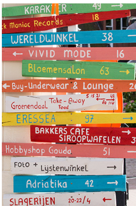
Foto: Verruiming van de mogelijkheden voor binnenstadondernemers om zich aantrekkelijker te presenteren.

In de binnenstad was veel dynamiek te zien waarbij sommige winkels helaas de deuren moesten sluiten, waarvan de V&D wel het meest in het oog sprong. Andere winkels in de binnenstad verhuisden naar een ander pand, verschillende pop-up winkels zijn gestart en ook zijn er nieuwe winkels, dienstverleners en horeca bij gekomen. Het aanbod aan detailhandel en horeca in de binnenstad krijgt mede door deze nieuwe vestigingen een steeds gevarieerder karakter.