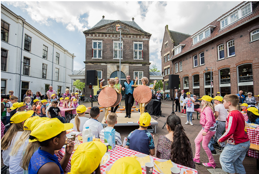
Foto: De kaasmarkt voor kinderen die in 2016 gehouden werd.

Het aantal kaasmarkten is uitgebreid waardoor het toeristisch seizoen is verlengd en het aanbod voor (inter)nationale touroperators is uitgebreid. Er zijn vier digitale 'kaasnieuwsbrieven' verstuurd aan personen/bedrijven die zich professioneel bezig houden met kaas en de website www.goudakaasstad.nl is geactualiseerd. In juni bracht een Franse delegatie van onder andere ambassade en parlement een bezoek aan de kaasmarkt. Eind 2016 is het startsein gegeven voor een haalbaarheidsonderzoek om een Cheese Experience in Gouda te vestigen. De provincie verzorgt een deel van de financiering in het kader van 'Cheese Valley', onderdeel van de 'Dutch Food and Cuisine' lijn van de NBTC. Ten slotte is in 2016 is een nieuw bestuur Gouda Kaasmarkt aangetreden.