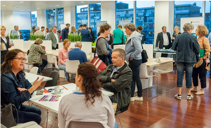
Foto: Informatiebijeenkomst voor startende en jonge ondernemers georganiseerd door ondernemersplatform Gouda Ondernemt en de gemeente Gouda.

De herontwikkeling van de 'Kop van de Kleiweg' en de uitvoering van de vernieuwing van het terrassenbeleid geven de binnenstad een impuls en laten zien dat de gemeente in de stad investeert. Juist in deze tijd is het van belang dat de basis op orde is om voor externe partijen aantrekkelijk te zijn als nieuwe vestigingsplaats. En bovenal voor bestaande partijen om te (blijven) investeren. Het grote aantal nieuwe vestigers in de binnenstad mag beschouwd worden als signaal dat deze aanpak werkt.