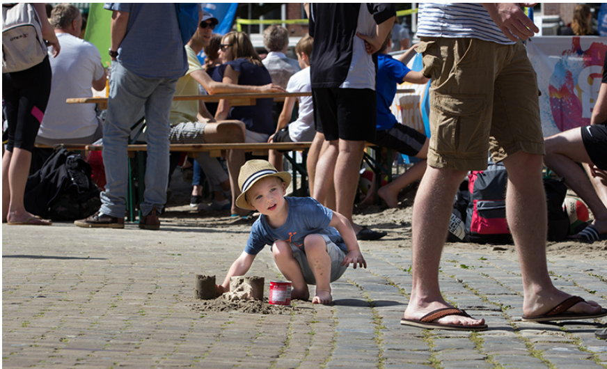
Foto: Gouda Beach Experience: de Markt werd weer omgetoverd in een zomers stadsstrand in het teken van sport, bewegen en speelplezier.

De Groeiling (RK), Stichting Klasse (Openbaar) en De Vier Windstreken (PC), en kinderopvangorganisatie Quadrant is vormgegeven.