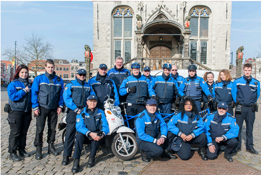
Foto: Het team van stadstoezichthouders in een nieuw herkenbaar uniform.